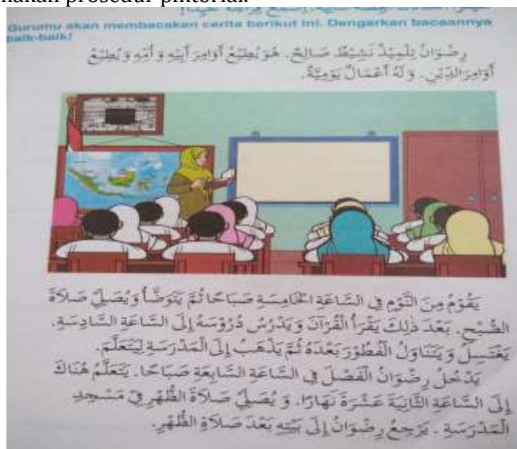
Gambar 2. Penerapan Prosedur Piktorial