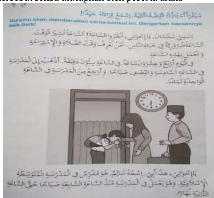
Gambar 4. Penerapan Prosedur Konteks

Gambar prinsip penerapan keautentikan materi pada buku “Aku Cinta Bahasa Arab untuk Kelas VII Madrasah Ibtidaiyah” Karya Agus Wahyudi.